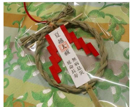
↑茅の輪のお守り 初穂料 500円